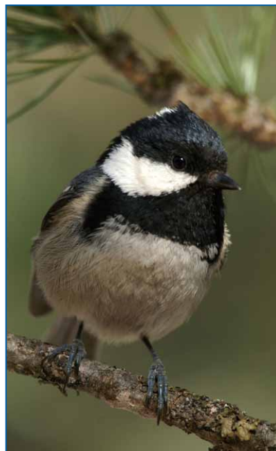
Abb. 4:

Wenn auch künstliche Nisthilfen in Wäldern mit wenig natürlichen Bruthöhlen zur Populationsvergrößerung sehr förderlich sind, ist naturnahe Waldwirtschaft doch das vordringliche Ziel, um stabile Bestände zu erhalten.