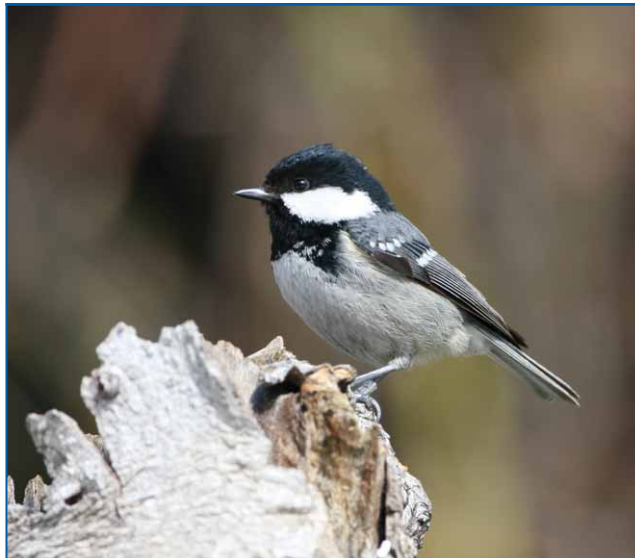
Abb. 1: