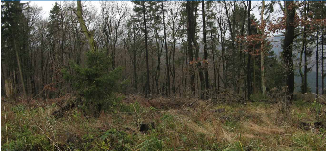
Abb. 3: Optimaler Lebensraum Eilper Berg in der Nähe des Ambrocker Steinbruches. Ein gut strukturiertes Mischwaldstück mit Totholz, funktionierender Naturverjüngung und sehr guter Krautschicht, 26.11.2008

Da sie in der Wahl des Biotopes flexibler als die Haubenmeise ist, ist sie insgesamt auch häufiger als diese. Aber auch bei für beide Arten günstigen Biotopbedingungen ist die Populationsdichte der Tannenmeise wesentlich höher, z. B.: